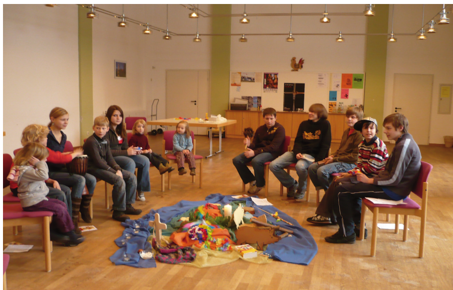
Die Eindrücke über Papua-Neuguinea finden Ausdruck in der farbenprächtigen gestalteten Mitte

Zum Kindergottesdienst gehörten neben den Informationen über Land und Leute – im Mittelpunkt steht hier natürlich die Situation der Kinder im Weltgebetstagsland – auch die Beschäftigung mit einzelnen Elementen der Weltgebetstags-Ordnung. Neben den Liedern sind das vor