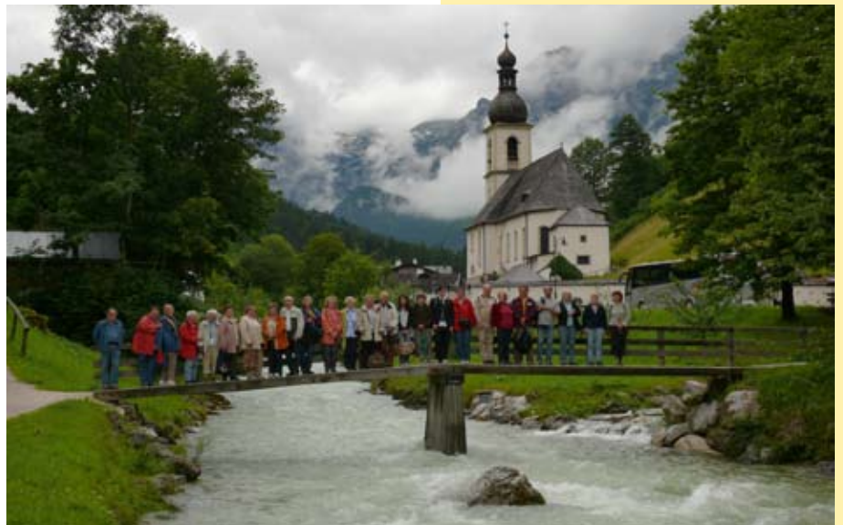
Ein weltbekanntes Motiv: die Brücke vor der Kirche in der Ramsau