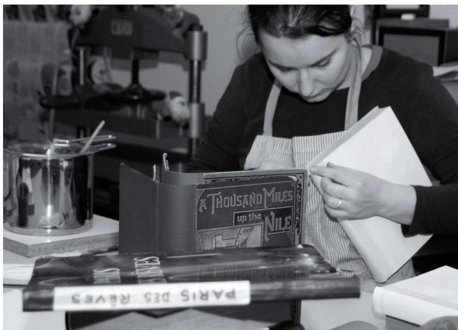
Buchbindeatelier Tiemeyer.